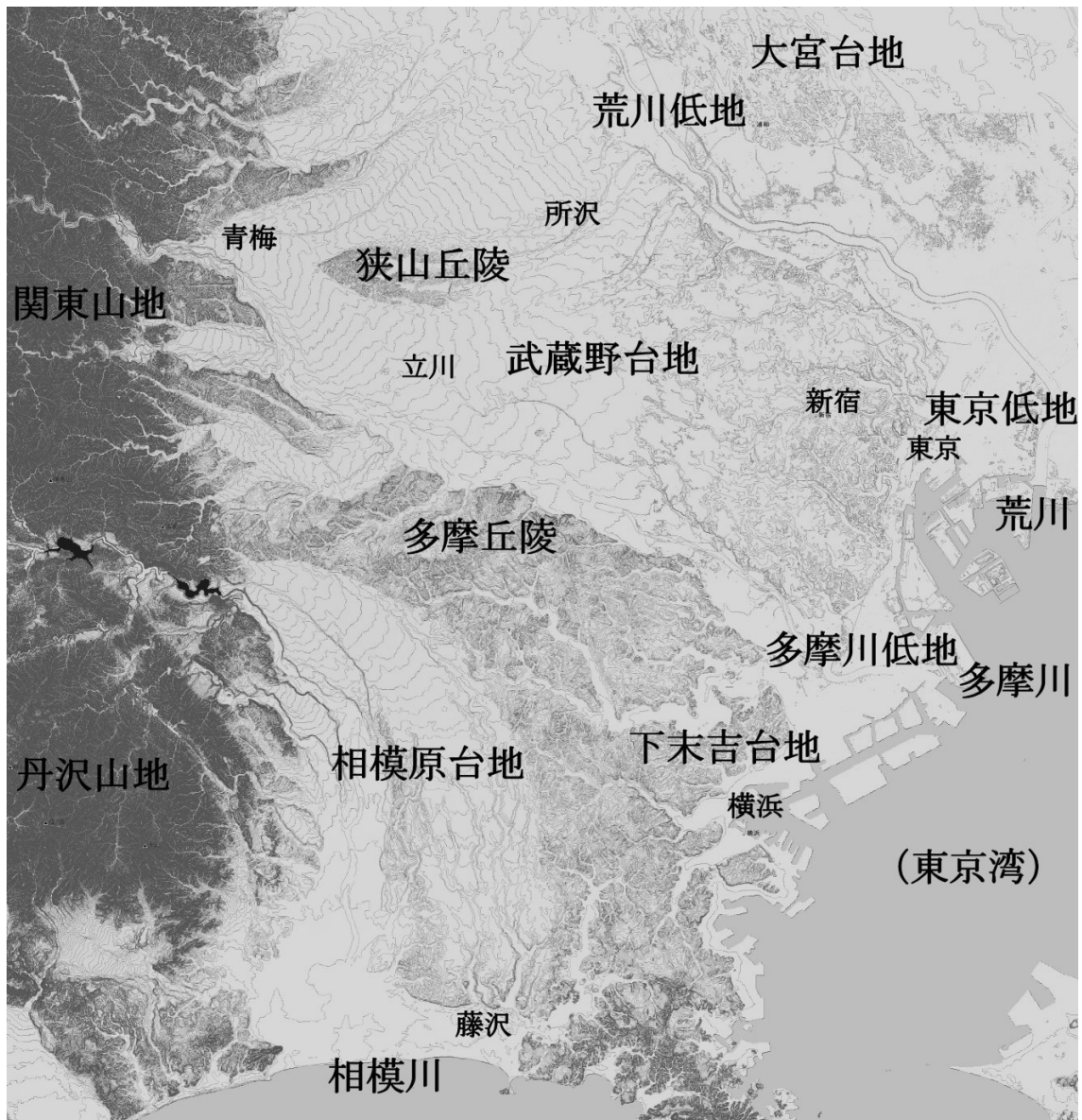
図1：東京周辺の地形分類（10m 等高線図）

色が濃いところほど、等高線の間隔が狭く、複雑な地形を示す。東京の土地の大半は武蔵野台地の上に存在する。相模川がつくった河岸段丘（相模原台地）と多摩川がつくった河岸段丘（武蔵野台地）の間、両河川の削り残しが多摩丘陵と横浜周辺の下末吉台地である。（国土地理院発行の数値地図 50m メッシュ及び 5m メッシュのデータをカシミール3Dの日本高密メッシュ標高セットにより加工した）